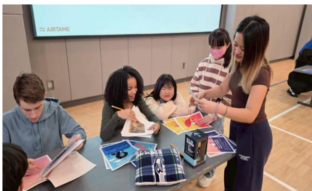
Uprep 的學生介紹西雅圖的特色與文化

上午由 Uprep 的學生為新民的同學介紹西雅圖的特色與文化並體驗當地的零食，下午新民師生搭乘 Uprep 的校車前往著名的傳統市場 Pike Place Market，進行 Scavenger Hunt 的尋寶任務，學生分組依所提供的線索按圖索驥找到各個景點，其中包含第一家的星巴克創始店，每個人也都現場親自點餐品嚐香濃的咖啡。接著尋找名叫 Rachel 的豬、飛魚(A Flying Fish)及口香糖牆(The Wall of Gum)等特色景點。