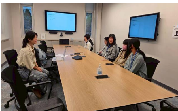
與 Uprep 的學生會(LEAD)幹部一起討論對話

上午第一節新民同學與 Uprep 的學生會(LEAD)幹部一起對話，彼此認識並探討領導力以及當下的社會議題，接著到中文班進行美食烹飪體驗飲食文化。