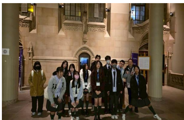
在華大圖書館體驗濃厚學術氣息