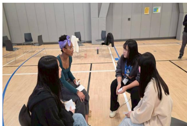
Uprep 的學生介紹美國的故事

上午第一節新民同學與學伴一起到各班上課，第二節社區時間(Community Time)則由 Uprep 的學生為新民的同學介紹美國的故事。下午新民師生進行第二次戶外教學，前往國際區即以前的中國城(China Town)參觀當地議員 Wing Luke 的博物館，並至當地的特色餐廳用餐體驗港式飲茶。