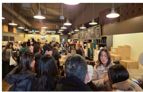
在星巴克創始店點餐享用咖啡