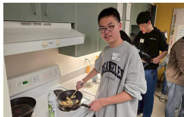
到中文班進行美食烹飪分享飲食文化