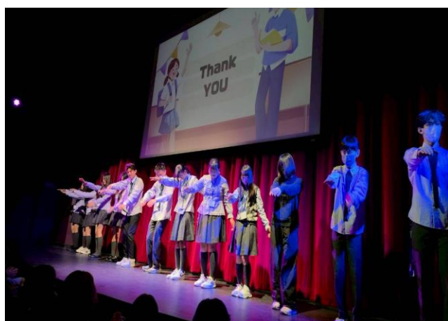
一起跳健康操展現活力