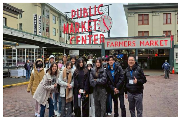
在派克市場了解當地的特色景點