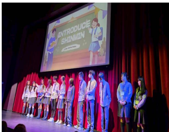
在學生大會介紹新民與臺灣

上午由新民的同學介紹學校特色，包含校史、校服、上課作息、特色活動如英日科話劇、表藝科國慶表演，進修部聖誕報佳音以及國際交流活動等。介紹臺灣的特色景點如日月潭、阿里山，美食文化如逢甲夜市、珍珠奶茶及臭豆腐，重要科技如台積電半導體等。下午則前往參觀華盛頓大學(University of Washington)，全球排名第7的公立大學學費比照私立名校收費，學生徜徉在如哈利波特魔法學院般的圖書館，感受到濃厚的學術氣息。此外也巧遇華大的臺灣同鄉會招募會員，看到碩大的國旗出現在美國大學校園令人感動。