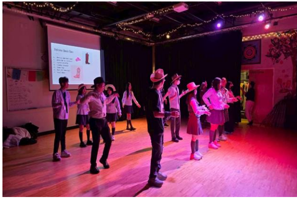
師生一起跳排舞體驗美國舞蹈文化