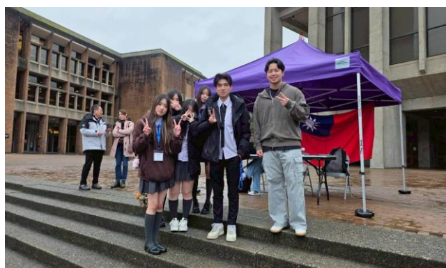
巧遇華大臺灣同鄉會成員