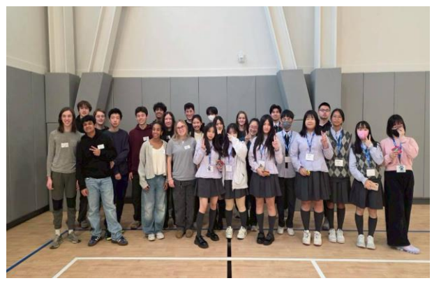
與中文班的學生一起進行交流活動