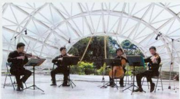
戶戶、不住的热情——亞太弦樂四重奏在花園繞行的士林官邸露天音樂座前，演奏國內外知名曲目，氣氛溫馨。 演出單位／亞太弦樂四重奏樂團

如果創意是藝術的要訣，這一群高效率的國家藝術基金會藝術行政人員以及日盛的蔡董事長已經是藝術家了。他們在SARS衝擊下，當台灣宣佈防範措施的同時，就及時跳出，把藝術不只重新拉回舞台，還將它推入民間；由密閉的空間帶到室外，他們搶在下班五點半的時刻，讓許多從捷運站走出的疲倦人群一片驚呼。這一群人，喜悅的站在國藝會為演出者臨時搭蓋的舞台前，他們臉上充滿了好奇，久久不忍離開。在近於一個月SARS陰影中，這群演出者似乎在告訴他們，新的景象將要來臨。