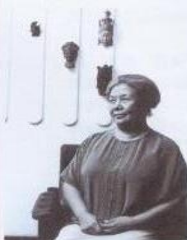
台灣第一位舞蹈博士劉鵬學，終身奉獻於舞蹈。