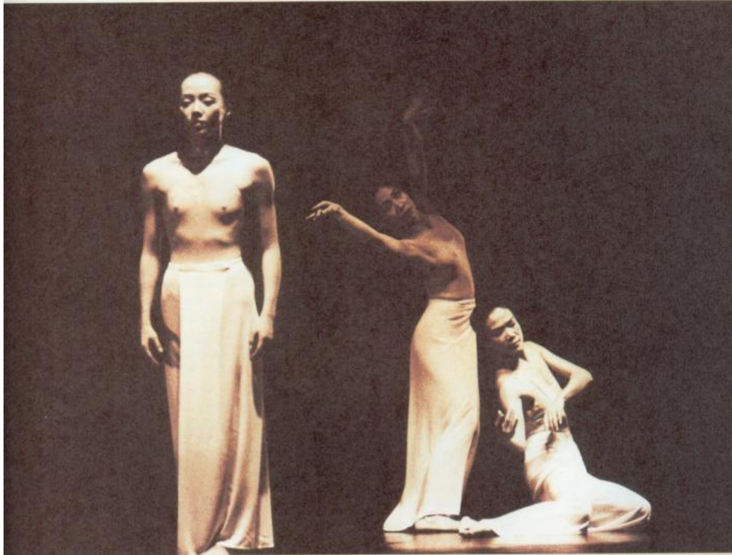
The Cloud Dance Troupe brought about a revival of Western modern dance in Taiwan.