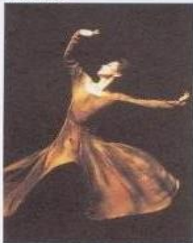
羅曼菲在舞台上讓身體像花一樣綻放，展現女性特質。