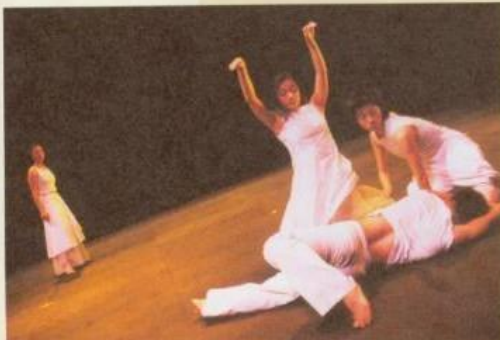
Wild Strawberries Dance Troupe's dancing focuses on women's issues.