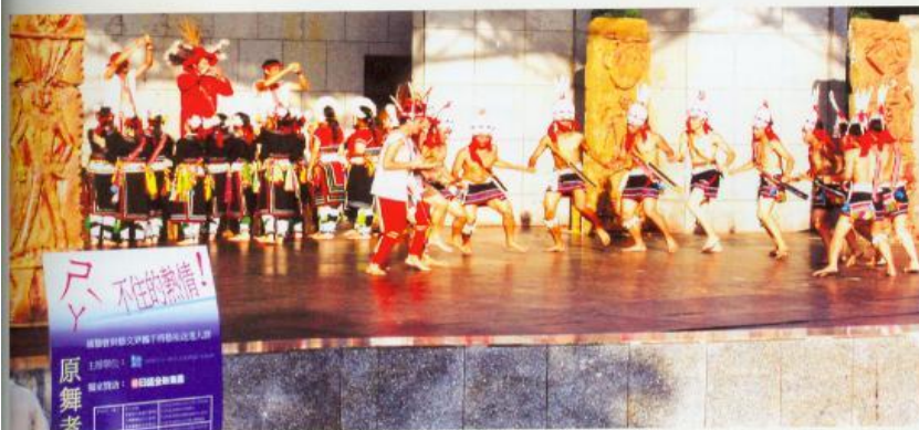
YY、不住的熱情——原舞者在台北大安森林公園藝臺，用舞蹈與台北市民共渡抗YY、時刻。 演出單位/原舞者

一般舞蹈的呈現方式，主要是透過舞者肢體的演出，而產生與現場觀眾交流的一種表演藝術形式；它很難僅用聽覺或長期停置於某處來呈現，也無法如美術般，可以藉展覽停駐某一時空。尤其是舞蹈演出係屬於於某一段時間聚集觀眾來欣賞的表演藝術，它與人群是密切相關的。因此，在遭受天災人禍時，因空間硬體遭到破壞或人們無法在同一時間聚集等諸多因素，舞蹈演出幾乎總是最受衝擊的一環，此時相關人員蓄積爆發的精力就十分具有挑戰性。「空間」(Space)、「時間」(Time)、「動力」(Energy)是舞蹈創作的三大要素，在這特殊的時刻中，我們是否也可藉舞蹈的三要素來省思舞蹈創作之泉源？