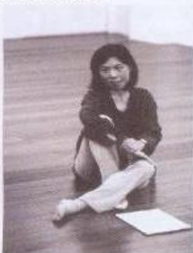
編舞家古名伸是台灣女性舞蹈界的中堅分子。