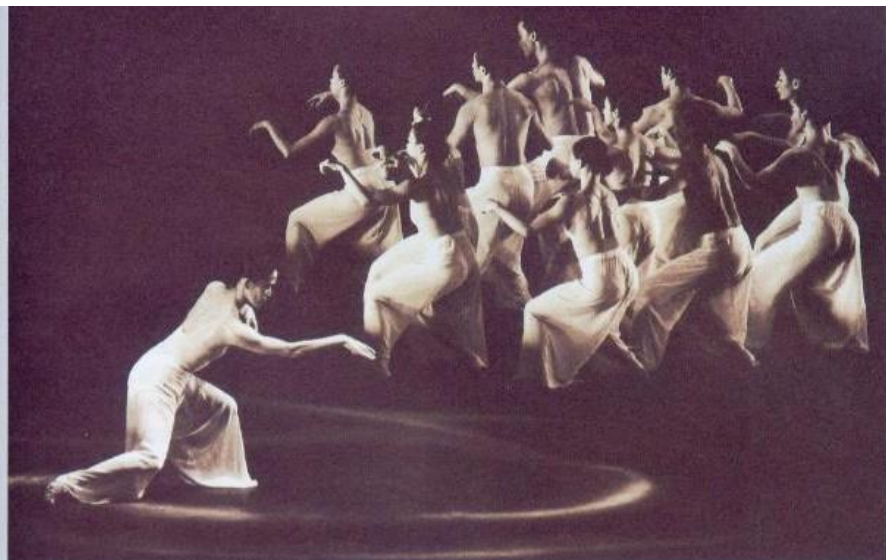
袁門與集帶回了西方現代舞劇的表演方式，舞者多為女性。

肢體的極致與舞技的高超為終極追求目標，而是以表達內心情緒的張力為訴求。她的畢業舞作「迴盪在風中的聲音」以蔡振南的「一隻烏仔啼啾啾」為背景音樂，訴說異鄉人的情懷。在場即使是無法了解歌詞的外國人，也能由舞者的肢體語言中了解她所欲傳達的意境，她感覺到觀眾與舞作之間刹那的相遇，不但為舞作加分，更是行銷舞蹈最重要的一環。在學期間，在舞蹈術科這個部分，教授竟然給了她「滿分」的超優異成績。她說：「其實我在去美國之前，已經有七年時間沒有認真的跳舞，因此，體力、年紀因素等狀況一定不如以前。但是我卻可以感覺到，在美國跳舞的那段日子，是我到目前為止，舞跳得最好的一段期間！」