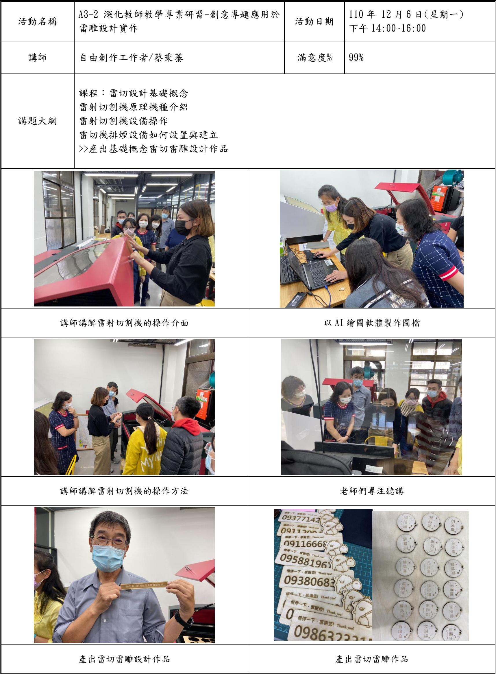
台中市私立新民高中活動成果記錄表