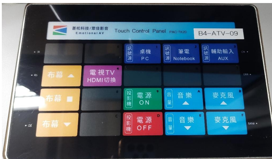
數位講桌控制面板